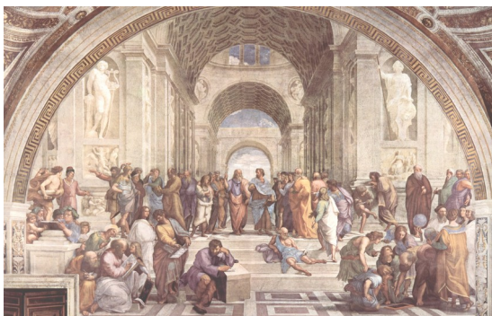
L'école d'Athènes en Grèce